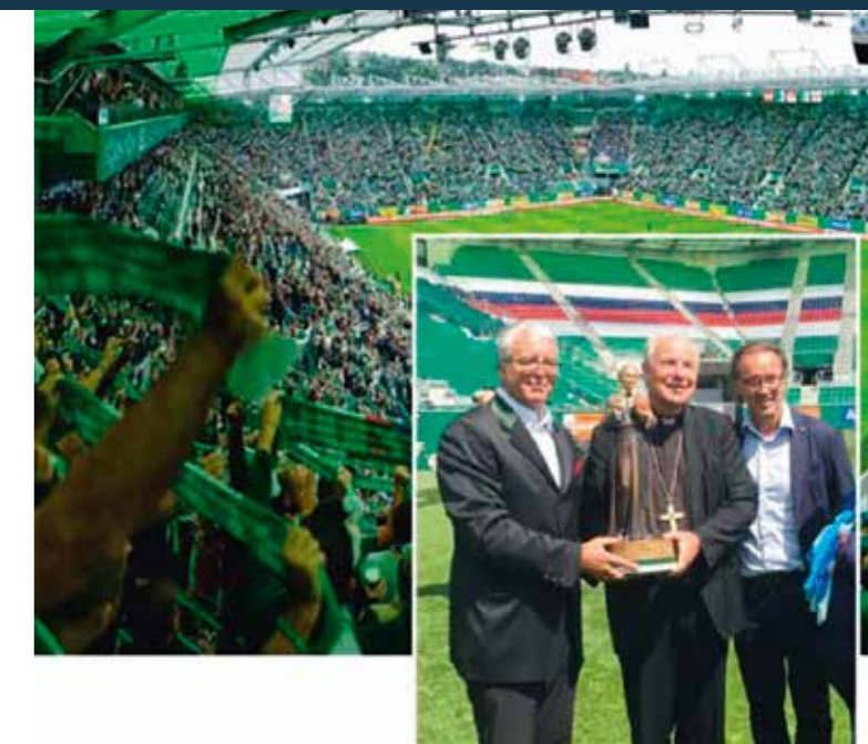
Der offizielle weltweite Schutzpatron wurde auch bereits im ersten großen Fußball-Stadion (Allianz Arena Wien) zum Schutz aller Fußballerinnen, Fußballer, Fußball-Fans und Stadien-Besucher aufgestellt!