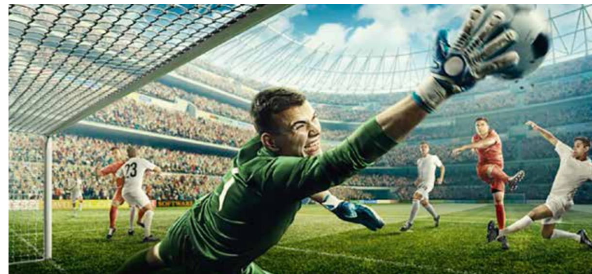
Erleben Sie ein Top-Fußballspiel in einem europäischen Stadion „live“.