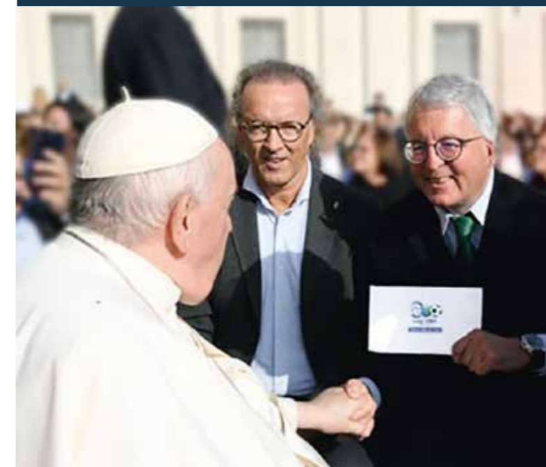
Bei mehreren Audienzen im Vatican wird auch diese Kooperation laufend gepflegt.