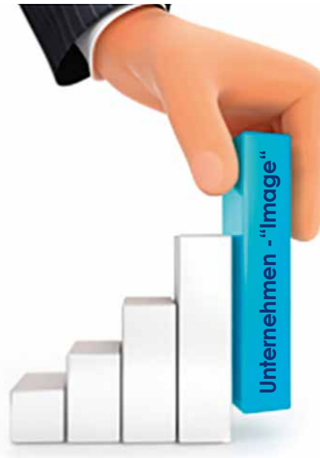
Image-Gewinn, der bleibt!

Sie „ankern“ mit der Emblem „Luigi 1884“ im Image-Sektor „sozialer, sportlicher- und unternehmerischer Vorbild-Ethik“. Sie profitieren vom Profil: Fairness, Vertrauen, Teamgeist, Aufrichtigkeit, Zusammenhalt, dem respektvollen Umgang untereinander sowie Grenzen überschreitende Zusammenarbeit.