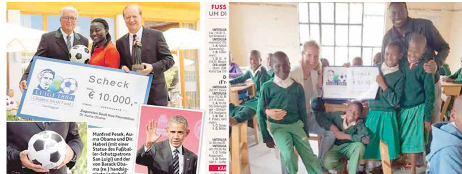
„Vor Ort“ tätige renommierte Hilfsorganisationen werden durch diese neue Bewegung unterstützt.